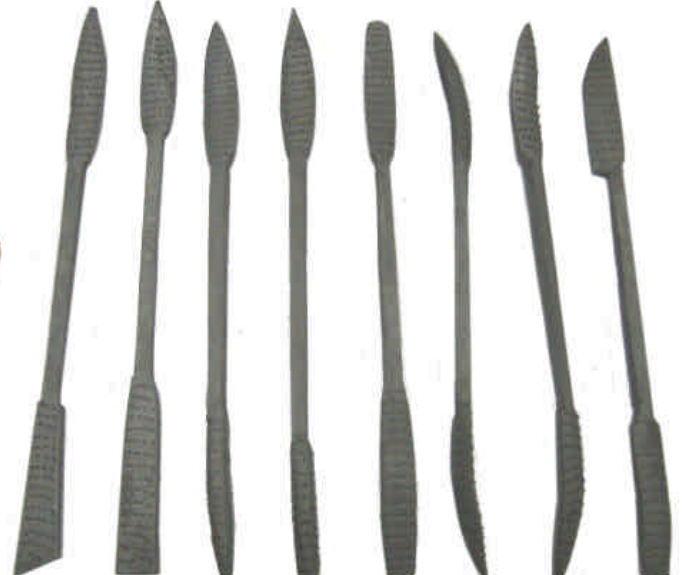
RS-06 -07 -02 -01 04 -03 -05 -08

Raspeln einzeln erhältlich RS-01 bis RS-08